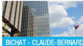
BICHAT - CLAUDE-BERNARD